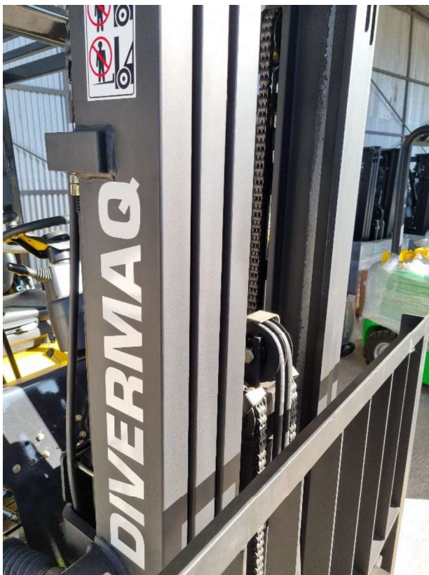
MASTIL TRABAJO PESADO THYSSENKRUPP ALEMANIA