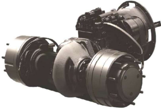
TRANSMISION TRABAJO PESADO TOYOTA IND.